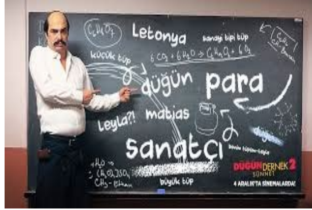
Resim 8: Filmindeki göstergelerin kültürel bağlamı ve anlam üretme süreci

Dil ve Semboller: Göstergüküre, heterojen yapısıyla bilinmektedir. İçerdiği diller çeşitli olup farklı işlevlere sahiptir. Tek bir ortak kodlama yapısından ziyade, birbiriyle ilişkili ama farklı sistemler içermektedir. Bu görüş, göstergebilim alanının karmaşık ve çok yönlü yapısını vurgulamaktadır. Diller arasındaki etkileşim ve çeşitlilik, bütüncül bir anlayışa ulaşmayı zorlaştırmaktadır. Ancak bu durum, göstergebilimin zenginliğini de ortaya koymaktadır (Lotman,1990, s. 124-127). Filmdeki karakterler, olaylar ve mekânlar dilin ötesinde sembolik anlamlar taşımaktadır. Örneğin, Tarık'ın Letonya'da çalışması ve Marika ile evlenmesi, kültürel değişimi ve farklılıkları sembolize etmektedir. Düğün, sadece bir toplumsal olay değil, aynı zamanda gelenekleri, değerleri ve sosyal ilişkileri simgelemektedir.