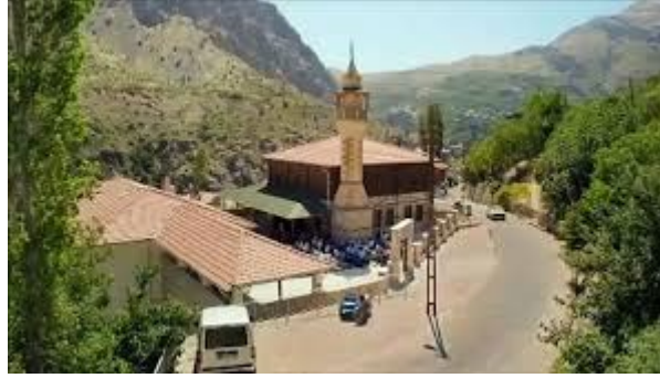
Resim 9: Camide bayram namazı

Mekân ve Zaman: Lotman'a göre kültür, belirli sınırları olan bir mekân içerisinde varlık göstermekte ve kendini bu mekânsal çerçeveye içerisinde ifade etmektedir. Aynı zamanda, kültür geçmişten günümüze uzanan bir zaman diliminde şekillenip dönüşmektedir. Geçmiş, bugün ve gelecek, kültürün sürekli değişim ve gelişiminin parçalarıdır. Kültürel bellek ise, geçmişle bağlantı kurulmasını sağlayarak, kültürün zaman içerisindeki sürekliliğini ve bütünlüğünü korumaktadır. Böylece, kültür kendini mekân ve zaman içinde konumlandırıp tanımlamaktadır. Bu iki temel boyut, Lotman'a göre, kültürün yapısını, işleyişini ve değişimini anlamak için önemli bir çerçeve sunmaktadır (Lotman, 2005, s. 205-229). Filmde geçen olayların çoğu, köy ve düğün mekânları arasında geçmektedir. Bu mekânlar, kültürünü koruyan bir köy ile değişime açık bir dünya arasındaki çatışmayı temsil etmektedir. Ayrıca, filmdeki zaman çizgisi, hızlı bir düğün hazırlığı sürecini içermekte, bu da kültürel değişim ve uyumun hızını vurgulamaktadır.