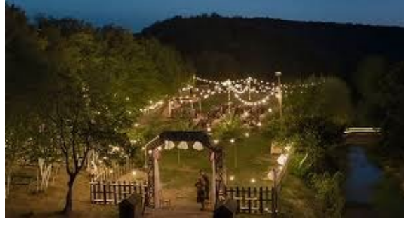
Resim 17: Düğün yapıldığı mekân

Düğün Töreni ve Ritüeller: Filmdeki düğün töreni ve ritüeller, kültürel sembollerin ve geleneklerin nasıl yaşatıldığını göstermektedir. Düğün, kültürel hafızayı canlı tutan bir ritüel olarak işlev görmektedir.