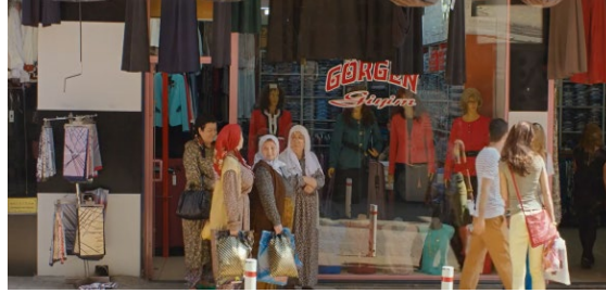
Resim 12: Düğün alışverişi

Maddi İmkânsızlıklar ve Toplumsal Değerler: İsmail'in, düğünü gurur meselesi haline getirip maddi zorluklara rağmen yapma kararı, toplumsal değerleri ve onur anlayışını temsil etmektedir. Bu durum, Lotman'ın kültür göstergebilimindeki "kültürel hafıza" kavramıyla açıklanabilmektedir. Düğün, köydeki insanların ortak hafızasını oluşturan önemli bir anı olarak öne çıkmaktadır.