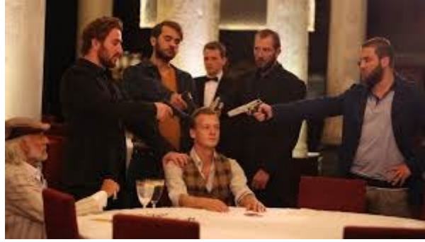
Resim 11: Mafyaların, gelinin kardeşini sorgulama sahnesi

Mafya Unsuru: Letonya'dan gelen gelinin nişanlısının mafyası, kültürler arası çatışma ve farklılıkları vurgulamaktadır.