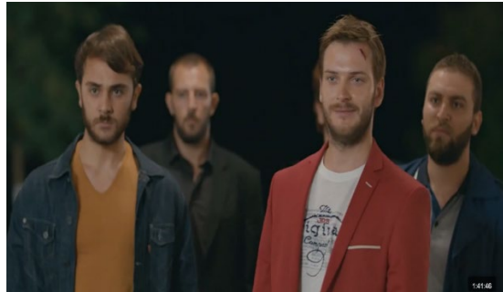
Resim 16: Kültürel tehdit "mafya" sahnesi

Mafya Unsurları ve Kültürel Tehdit: Letonya'dan gelen gelinin nişanlısının mafyası, kültürel tehdit unsuru olarak işlev görmektedir. Film, dışarıdan gelen etkenlerin kültürü nasıl etkileyebileceğini göstermektedir.