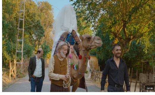
Resim 10: Gelinin düğün yerine götürülme sahnesi

Olayların Gelişimi: Filmdeki komik olaylar ve beklenmeyen durumlar yaşanmaktadır. Örneğin, gelinin devenin sırtında kaybolması ve Letonya'dan gelen gelinin nişanlısının düğünü basması, göstergebilimsel bir kopuş yaratmakta ve beklenmeyen olaylar zincirini ortaya çıkarmaktadır.